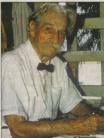
Tropenarzt und Vordenker des Tierschutzes: Albert Schweitzer (1875-1965).

A lbert Schweitzer war gewiss in jeder Hinsicht ein außerordentlicher Mensch und bestimmt auch Pionier in Sachen „Ärzte ohne Grenzen“. Aber er war – das darf nicht unerwähnt bleiben – nicht nur Philanthrop, sondern auch ein großer Freund der Tiere und somit auch Vorreiter auf diesem Gebiet. In